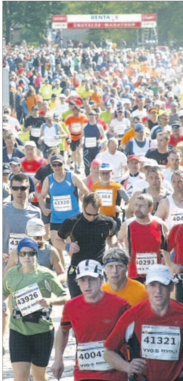
Noch mehr Läufer: Mit 4 700 Teilnehmern verzeichnet der Oberelbe-Lauf erneut eine Steigerung.